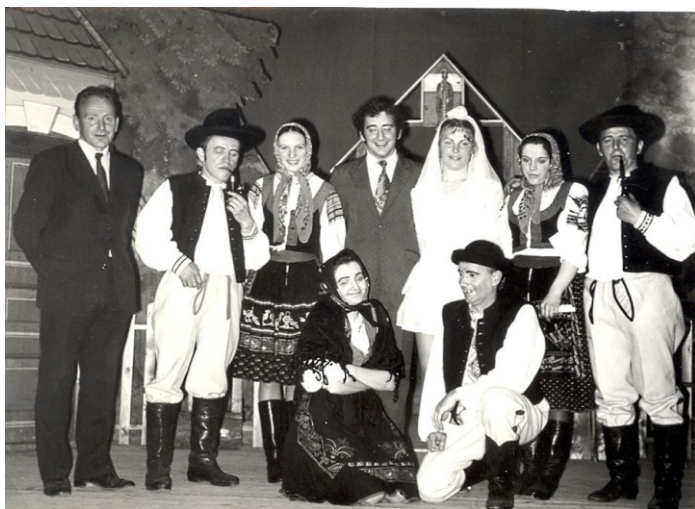
Fotografie z predstavení starších ochotníkov „Nešťastná“ a „Páva“.